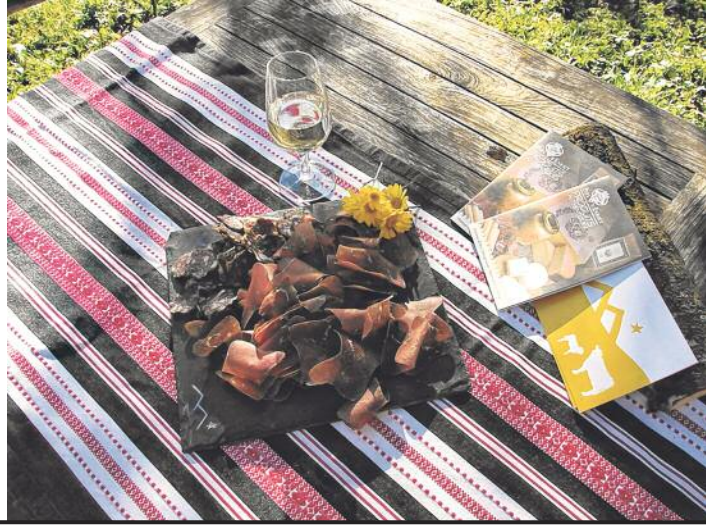
Pays-d'Enhaut – Produits authentiques, une aide précieuse pour ouvrir de nouveaux marchés.