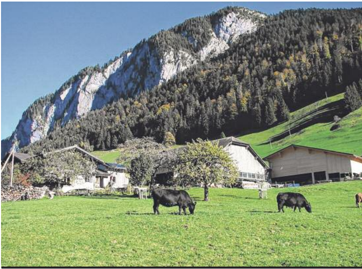
Vue de la ferme familiale et des deux stabulations avec, au premier plan, les bovins Aberdeen Angus.